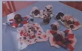
Réalisation d'un tapis de feutre.