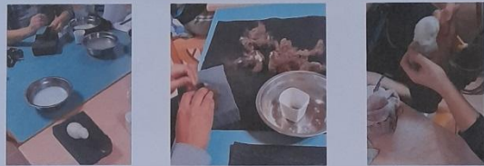
Modelage au savon et finitions à l'aiguille.